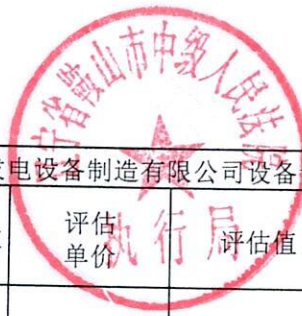
附件二：辽宁华源风力发电设备制造有限公司设备请求冻结明细