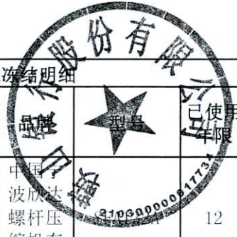
附件二：辽宁华源风力发电设备制造有限公司设备请求冻结明细