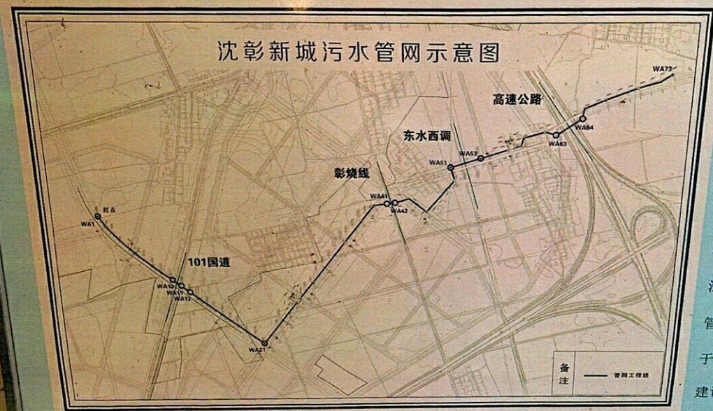
沈彰新城污水管网示意图

沈彰新城管线与污水处理厂联通工程 管线总长度4.373公里，污水提升泵站2座，穿越点4处（穿越G101公路、G25长深高速、辽西北供水管线、县道彰烧线）。 于2020年10月底开工建设，已全线贯通。